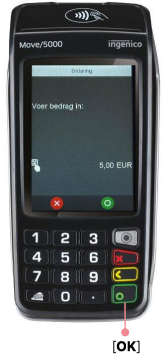
Voorbeeld geslaagde transactie